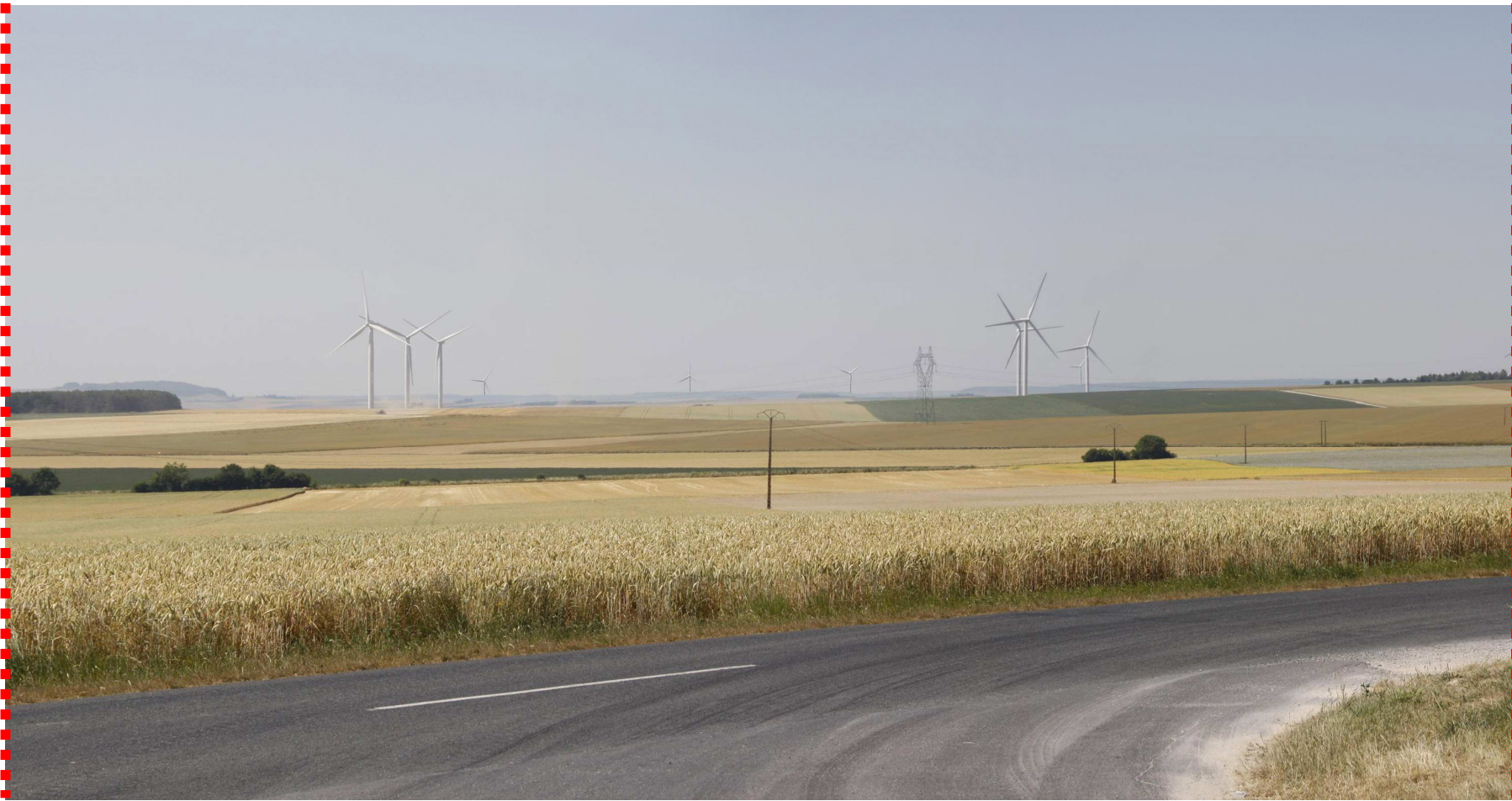
Photomontage recadré à 60°