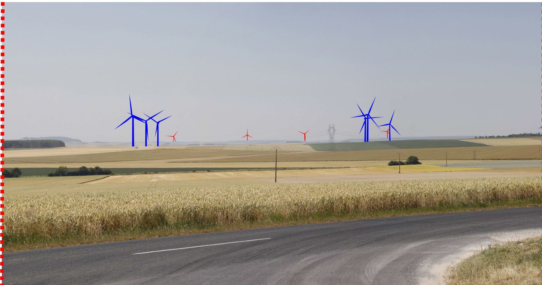
Photomontage d'interprétation recadré à 60°